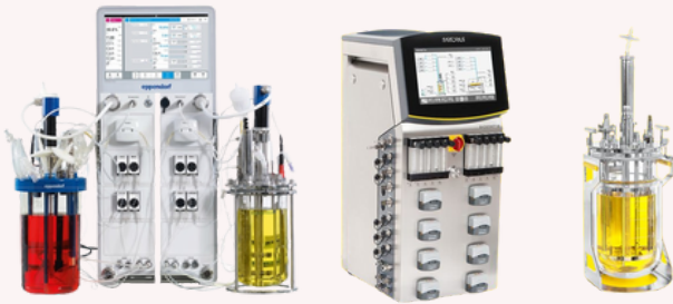
SciVario Twin TM