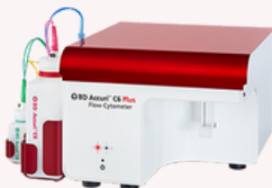
BD Accuri™ C6 Plus