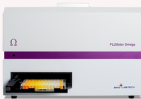
T100 Thermal Cycler FLUOstar Omega