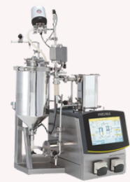
Sartoflow® Slice DW